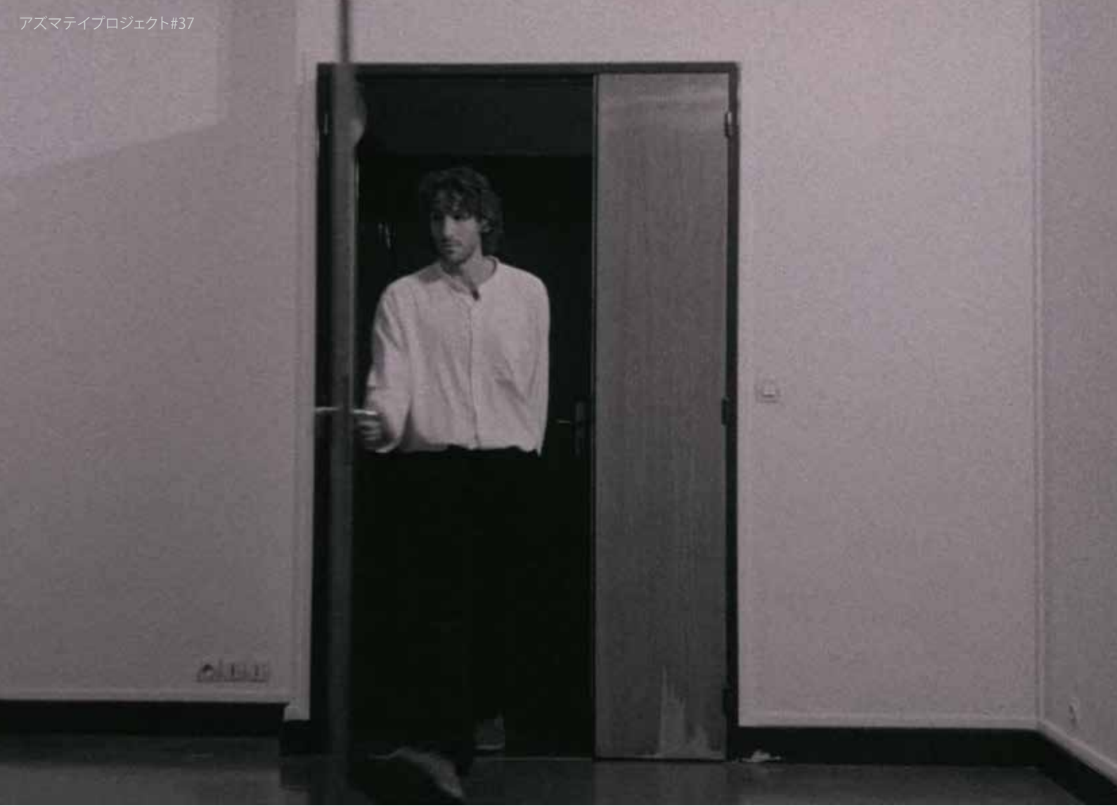
Zwei Türen | Axel Töpfer, Björn Kämmerer 2021 16mm movie, 1min